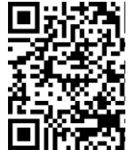
圖書資訊處 準新生借書證申請