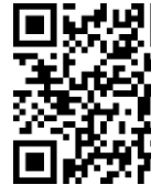
通識中心 書香計畫